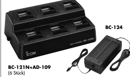
BC-121N+AD-109 (6 Stück) BC-124

<Für Einsatz an Bord> BC-121N MEHRFACHLADEGERÄT + AD-109 LADEADAPTER + BC-124 NETZTEIL Zum Schnellladen von bis zu 6 BP-224-Akku-Packs (6x AD-109 werden benötigt). Ladezeit für den BP-224 1,5 bis 2 Stunden und für den BP-225 2,2 bis 2,8 Stunden.