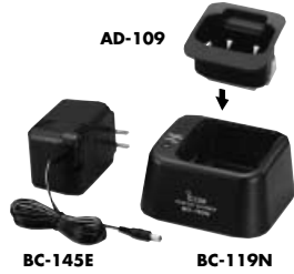
AD-109 BC-145E BC-119N

<Für Einsatz an Bord> BC-119N TISCHLADEGERÄT + AD-109 LADEADAPTER + BC-145E NETZTEIL Zum Schnellladen der Akku-Packs. Ladezeit für den BP-224 1,5 bis 2 Stunden und für den BP-225 2,2 bis 2,8 Stunden.